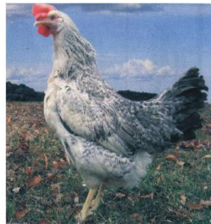
Материнська форма: "Бірківська барвіста"