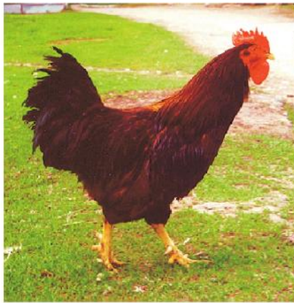
Батьківська форма: червоний род-айленд

Нові гібридні комбінації яєчно-м'ясних курей