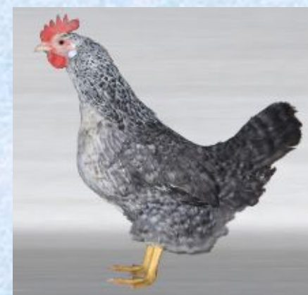
Материнська форма: "Бірківська барвиста"