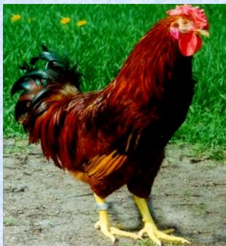
Батьківська форма: Полтавські глинясті