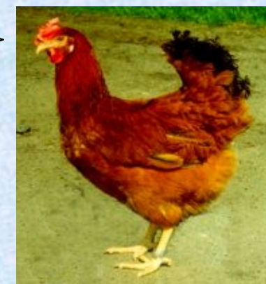
Гібридна несучка кросу