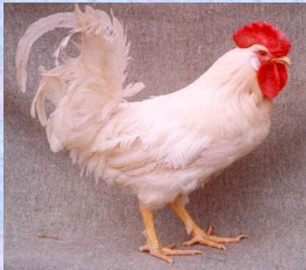
Білий леггорн з геном "К"