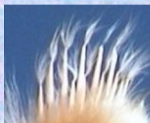
Курочки – швидке оперення