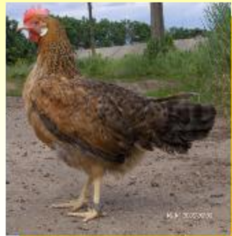
Материнська форма: Золотистий легорн