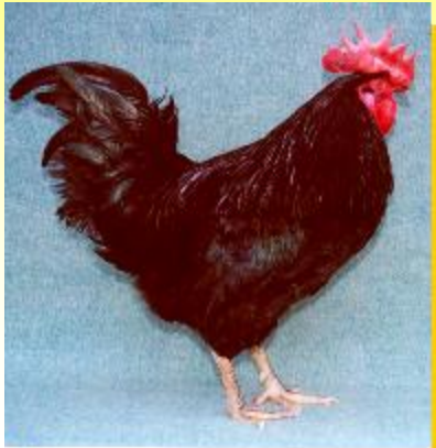
Батьківська форма: Австралорп