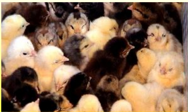
Добовий молодняк – різнокольоровий